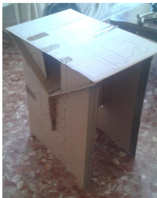
Figure 5. Table pliante en carton